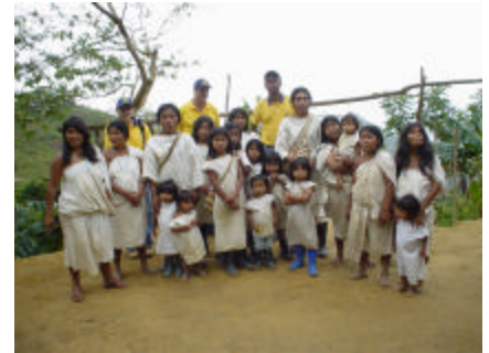
Comunidad Kogui Beneficiaria Proyecto Telefood.

Puede hacer su donación consignando en la cuenta No 01280658-4 del Banco Unión a Nombre de Representación FAO