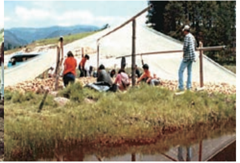
Práctica en secado de cebolla de bulbo. Unidad Holanda. UPTC Municipio de Duitama, departamento de Boyacá.

Para aumentar la producción y la seguridad alimentaria conservando y ordenando al mismo tiempo los recursos naturales, como prioridad concreta la FAO pretende fomentar la agricultura y el desarrollo rural sostenible.