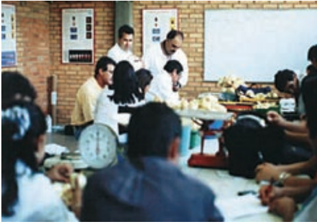
Práctica de manejo poscosecha de cebolla . UPTC Municipio de Duitama, departamento de Boyacá.