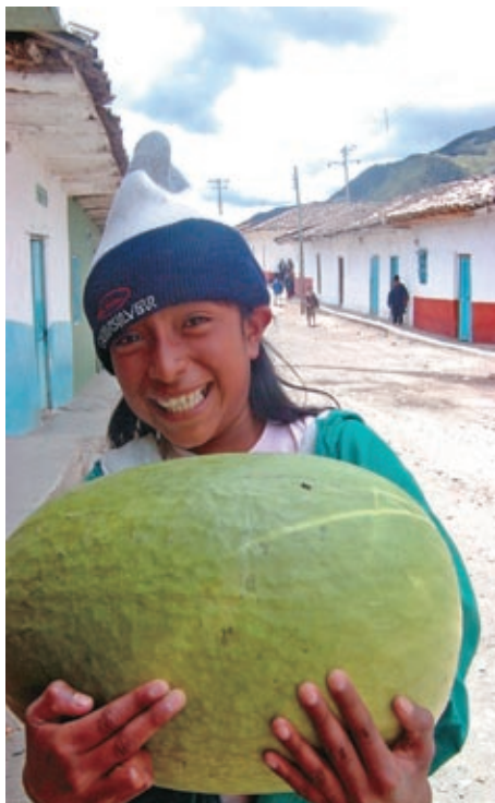
Proyecto Promacizo. Mesa de trabajo Río Blanco. Municipio de Sotará.