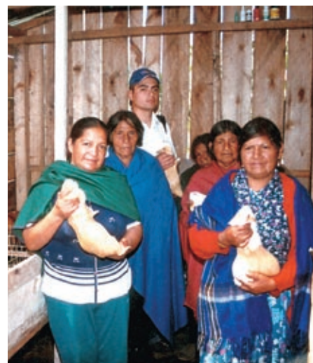
Mujeres campesinas e indígenas beneficiarias del proyecto Telefood de la crianza de cuyes.

1) Se está apoyando al Ministerio de Agricultura y Desarrollo Rural (MAGDR) y su equipo negociador con el Fortalecimiento de las capacidades de formulación, negociación y gestión de políticas comerciales y de Desarrollo del Ministerio de Agricultura y Desarrollo Rural . Las negociaciones internacionales de comercio, dentro de las cuales las más importantes e inmediatas son el Tratado de Libre Comercio con Estados Unidos (TLC), que debe concretarse durante los próximos meses; tienen altísima relevancia para las políticas del Gobierno Nacional para la población rural y el sector agropecuario, dados los altos impactos sociales que tienen las decisiones de apertura de mercados, de importación o exportación, sobre amplias regiones y grupos sociales vinculados a estas actividades. Los acuerdos que se tomen son de gran importancia estratégica en el campo económico, social y ambiental; por eso es necesario que el pueda diseñar y poner en marcha las políticas requeridas para maximizar los beneficios netos de estos acuerdos.