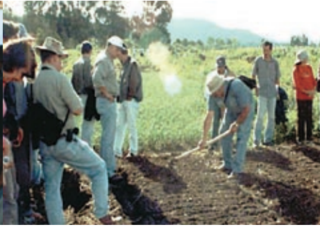
Día de campo en semilleros de cebolla de bulbo. UPTC Municipio de Duitama, departamento de Boyacá.