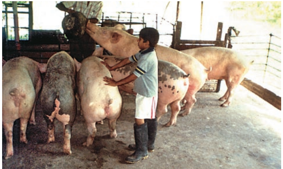
Proyecto Porcícola Asociativo para una vida mejor. Municipio de Rivera, departamento de Huila.

11) Colombia participa en el proyecto global Reducción del impacto ambiental de la pesca por arrastre de camarón tropical, mediante la introducción de tecnologías de