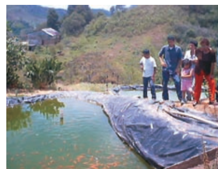
Producción de peces por estanque proyecto de Telefood. "Establecimiento de Unidades Piscícolas para beneficiarios de Reforma Agraria.

13) Establecimiento de unidades piscícolas para beneficiarios de reforma agraria. Córdoba - Quindío.