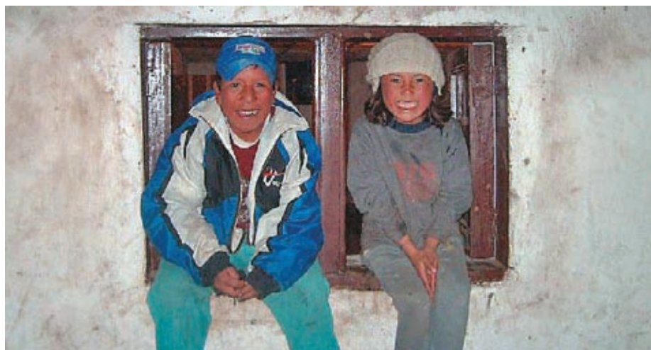
Proyecto Promacizo. Niños Cabildo Indígena Papallaqta. Municipio de San Sebastian.