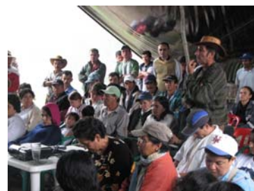
Participantes encuentro de socialización