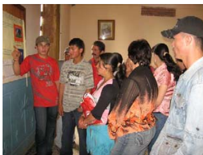
Asociación Agropecuaria Frutos de Mi Tierra en la vereda Ovejas del municipio de San Vicente.

Desde la primera semana de junio y durante dos meses y medio, se realizarán actividades para la formulación de la segunda fase del Proyecto de Seguridad Alimentaria y Buenas Prácticas Agrícolas para el Sector Rural en Antioquia. Este proceso será