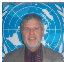
Por: Luis Castello: Representante de la FAO en Colombia

Vemos con preocupación la aparición de nuevos elementos que se suman la amenaza permanente del flagelo mundial del hambre. A pesar de las múltiples advertencias, el mundo ha seguido actuando durante décadas con indiferencia ante esta tragedia. Solo hasta ahora, cuando comunidades enteras llevadas por el desespero y el hambre reclaman de viva voz su derecho a alimentarse, alarmados fijamos la mirada en este drama de grandes proporciones. Hoy ha dejado de ser silencioso, ocupando los titulares de los medios masivos de comunicación en todo el mundo.