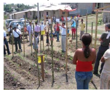
Comunidad de Sincelejo trabajando en un CDC

Ya son 5.300 las personas que participan activamente en el proyecto, en 54 veredas, 12 barrios y 11 municipios de los Departamentos de Sucre y Bolívar.