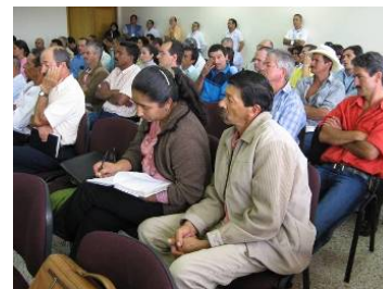
Presentación de avances del proyecto a representantes y administradores municipales

Finalizado el proceso de formulación, se espera obtener un documento de propuesta para la extensión del Proyecto para el período 2009-2011, que contemple la presentación de tres escenarios en función de la ampliación de las acciones del proyecto (nuevas ECAS y municipios, cadenas productivas adicionales y la implementación de huertas familiares y comunitarias rurales, urbanas y periurbanas).